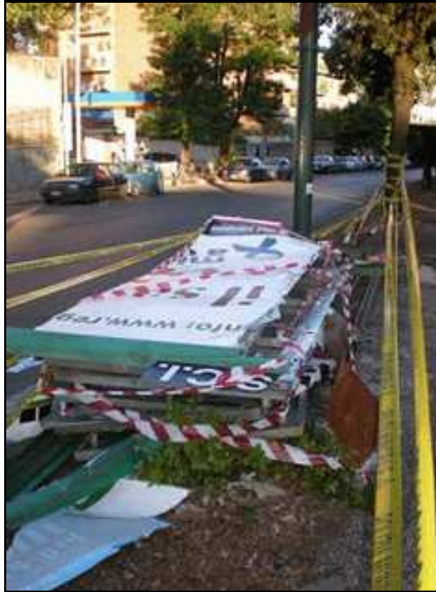
Via Ottavio Gasparri dopo l'incidente (21 giugno 2011)