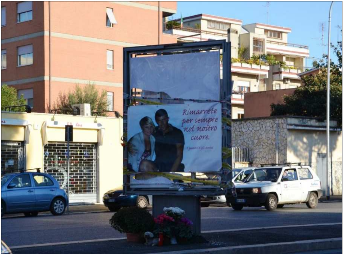
Spartitraffico centrale di via Tuscolana: 2 morti (2 novembre 2011)