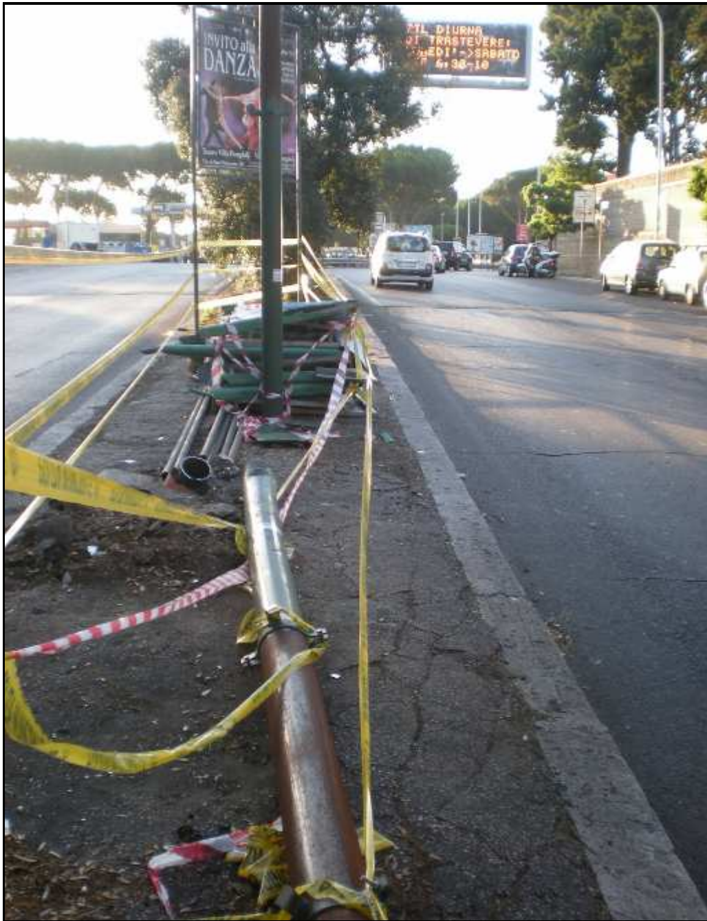
Via Ottavio Gasparri dopo l'incidente (21 giugno 2011)