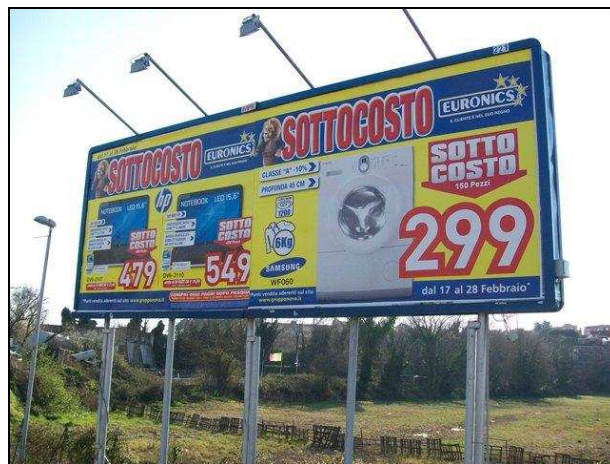
Via Flaminia vecchia