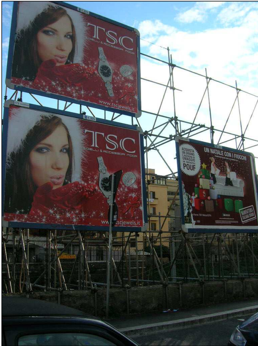
Alberone – ferrovia