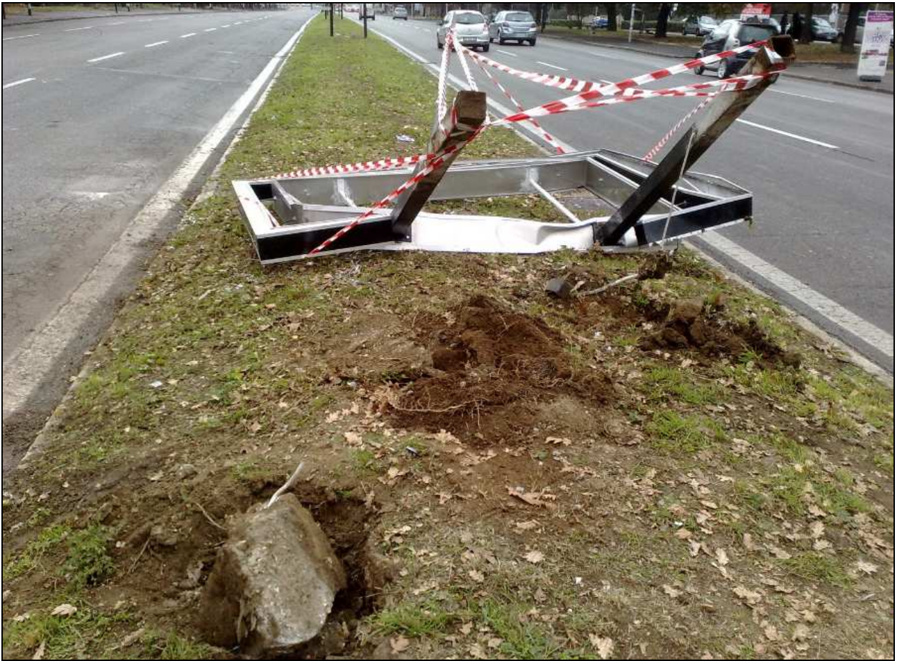
Spartitraffico centrale della via Cristoforo Colombo compreso tra il palazzo dello Sport e viale dell'Oceano Pacifico (2 gennaio 2012)