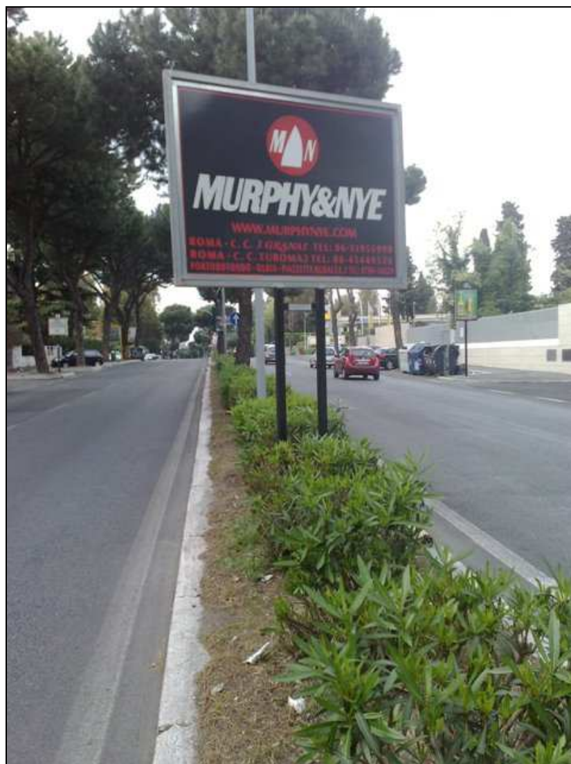
Via Laurentina altezza via del Serafico