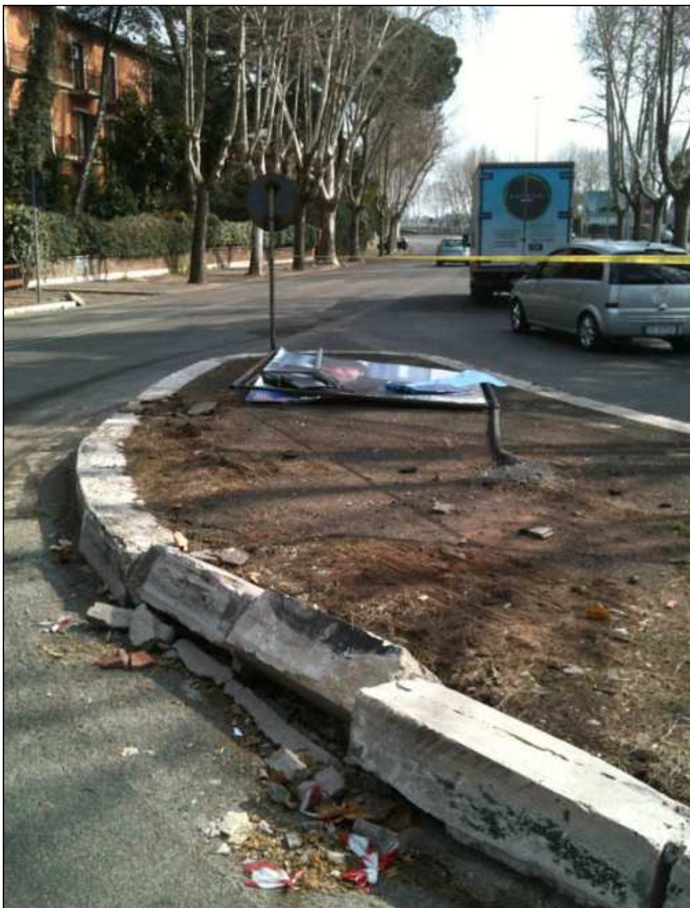
Svincolo tra via Marco Polo e via Odoardo Beccari (5 marzo 2012)