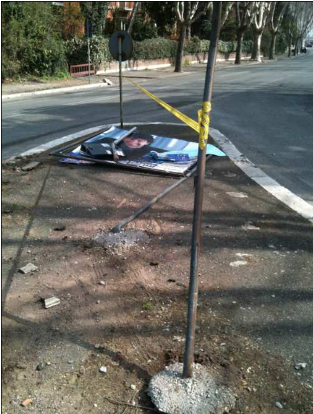
Svincolo tra via Marco Polo e via Odoardo Beccari (5 marzo 2012)