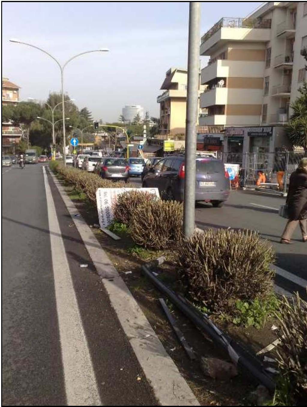
via Laurentina 627 all'altezza di Via dei Sommozzatori (15 marzo 2011)