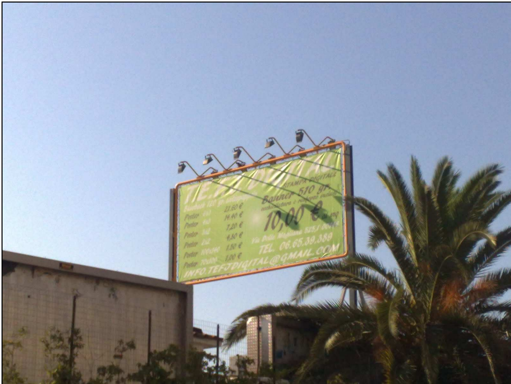
Via Laurentina altezza civico 853