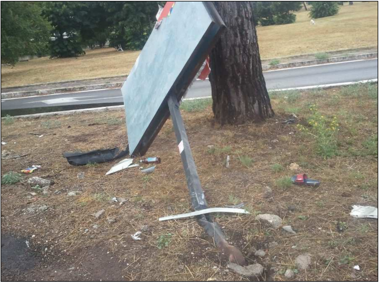
rotatoria tra via della Grande Muraglia a via Don Pasquino Borghi, tra Mostacciano e Torrino (24 luglio 2012)