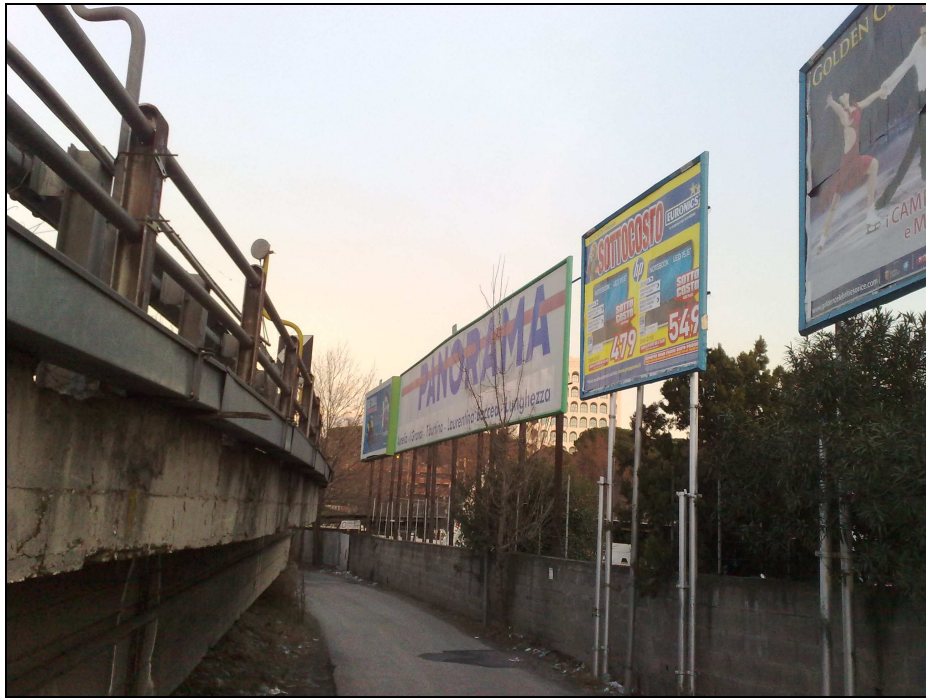
Viadotto della Magliana