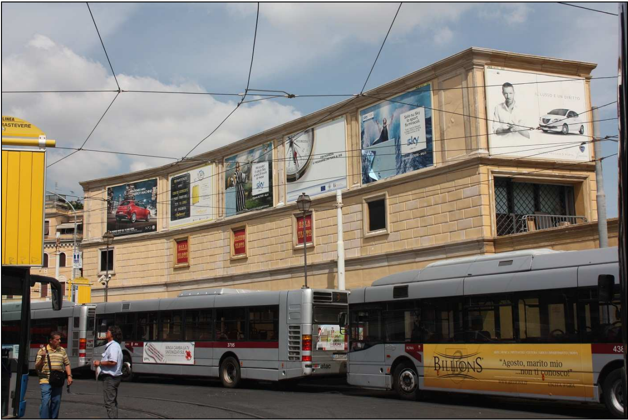
Piazza Flavio Biondo