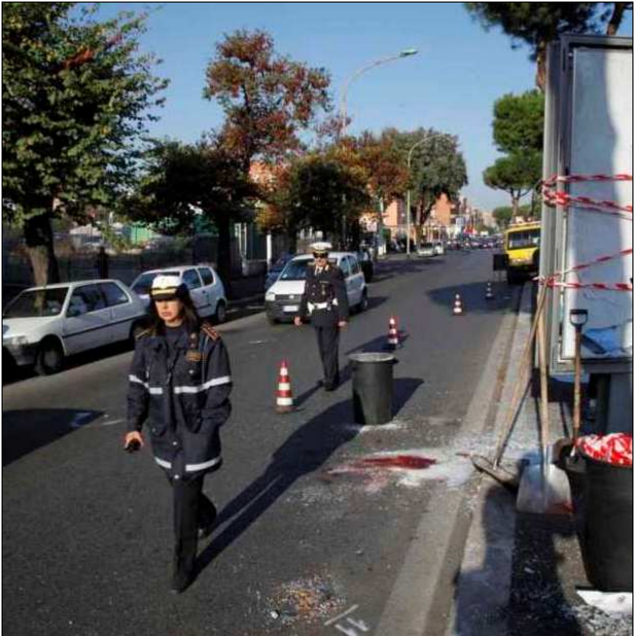
Spartitraffico centrale di via Tuscolana: 2 morti (2 novembre 2011)