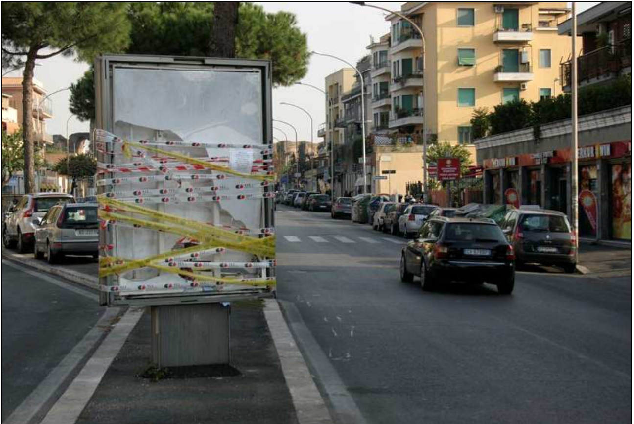
Spartitraffico centrale di via Tuscolana: 2 morti (2 novembre 2011)