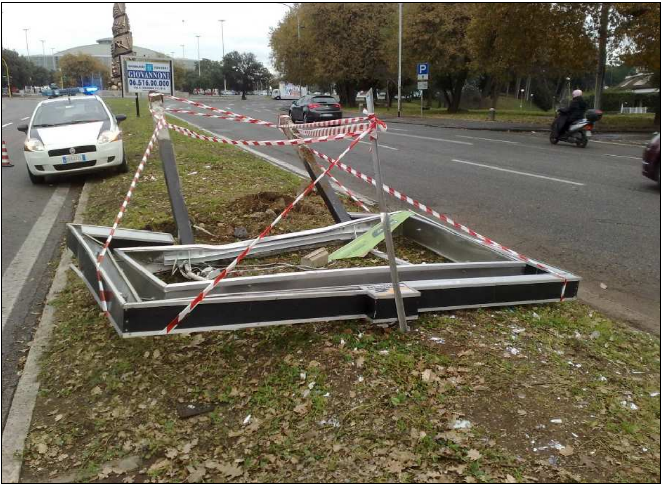
Spartitraffico centrale della via Cristoforo Colombo compreso tra il palazzo dello Sport e viale dell'Oceano Pacifico (2 gennaio 2012)