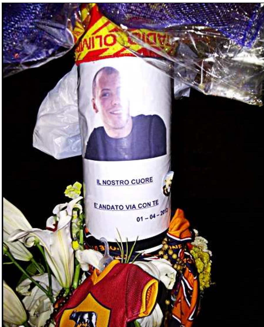
Viale di Tor di Quinto (1 aprile 2012)