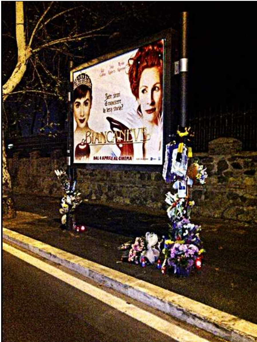
Viale di Tor di Quinto (1 aprile 2012)