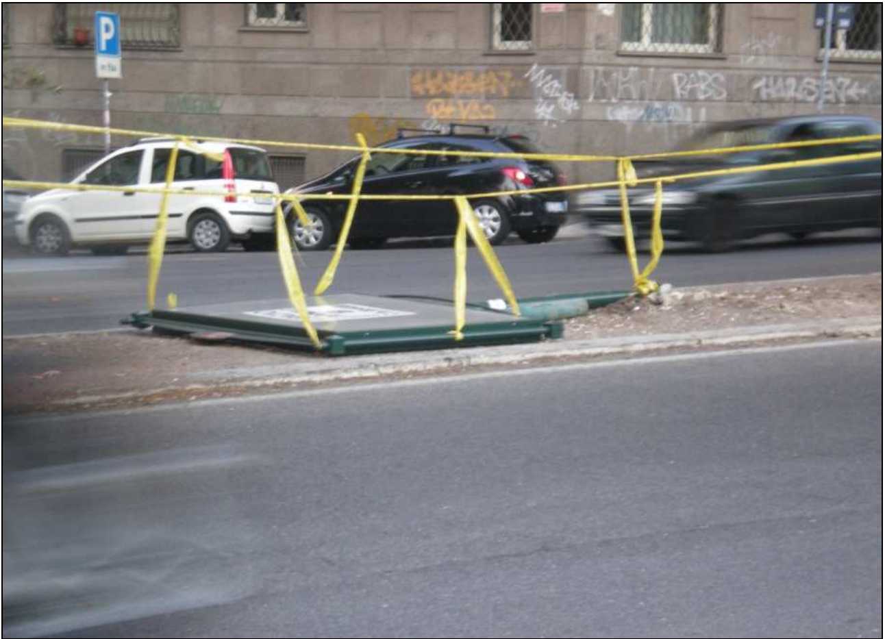
Spartitraffico centrale di via Leone XIII (21-22 ottobre 202011)