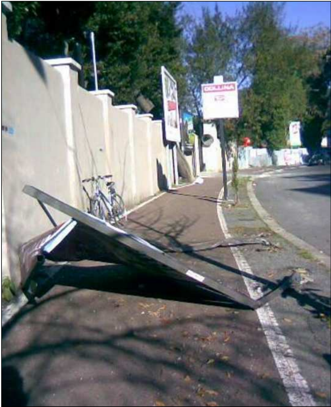
Via Panama (8 gennaio 2012)