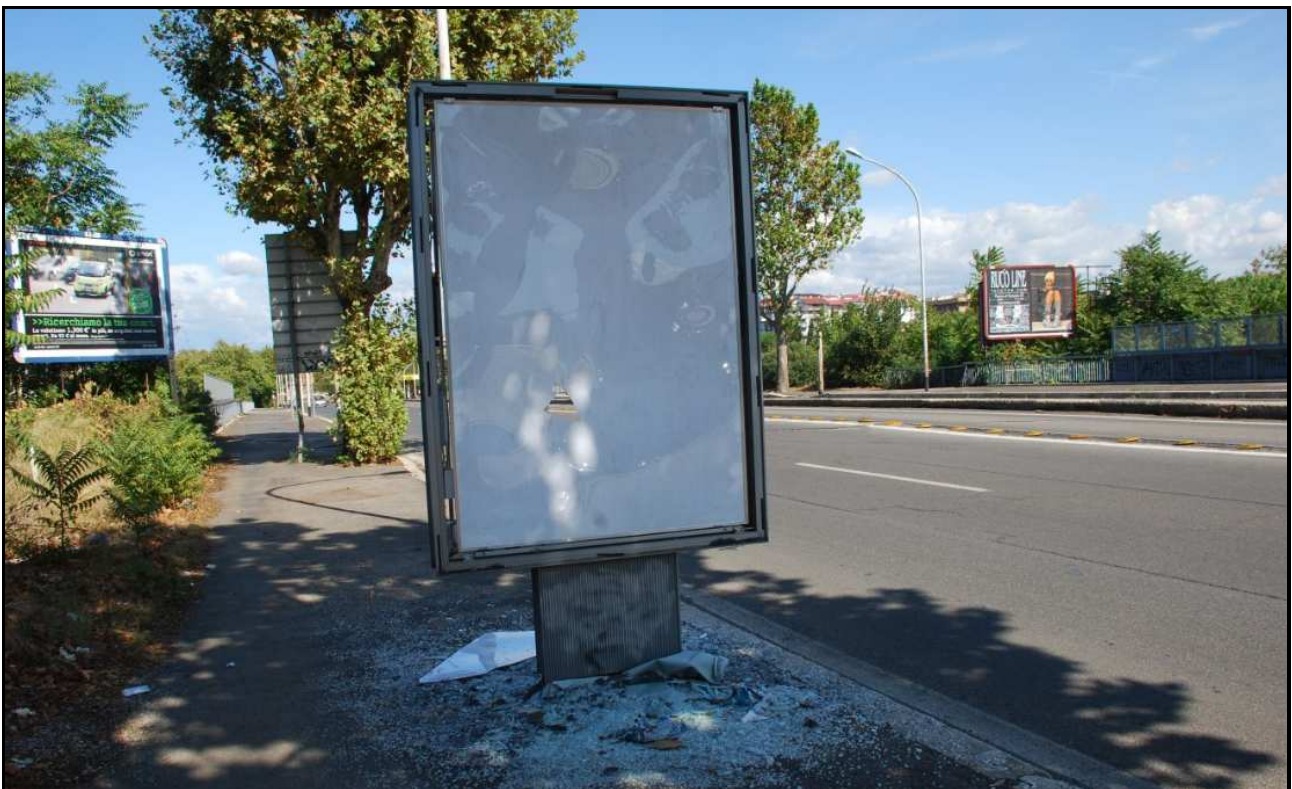
Via delle Valli (20 settembre 2011)