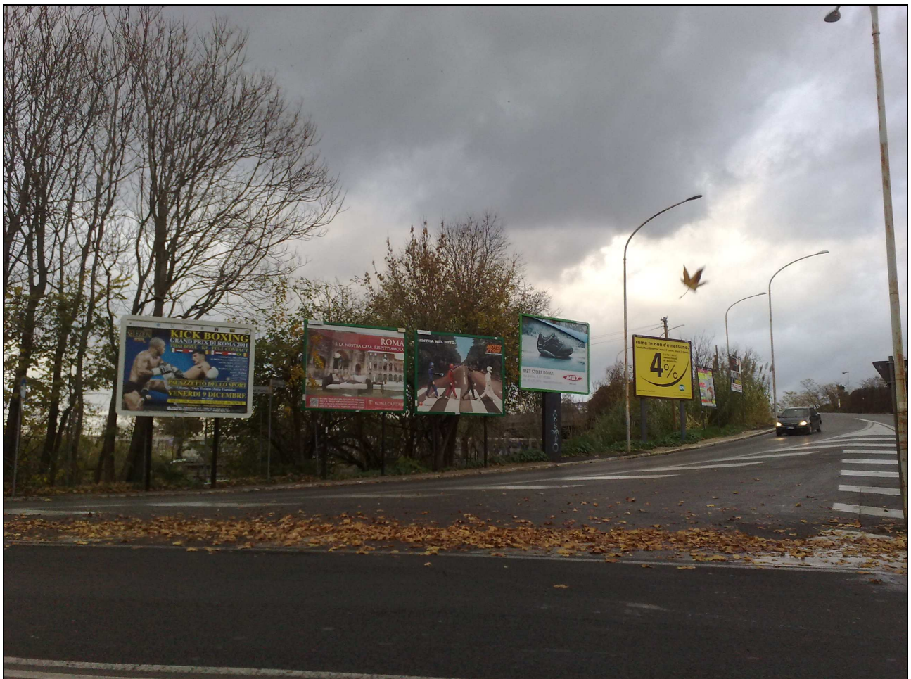
Via delle Tre Fontane