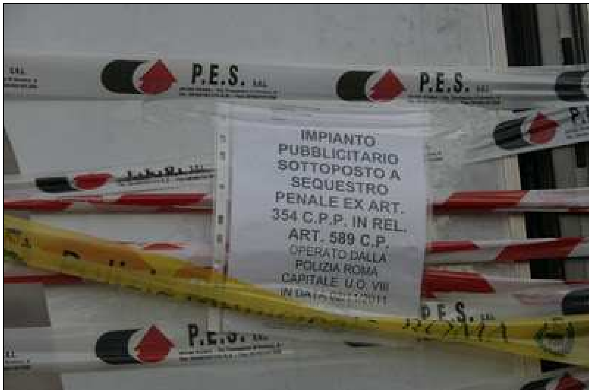
Spartitraffico centrale di via Tuscolana: 2 morti (2 novembre 2011)