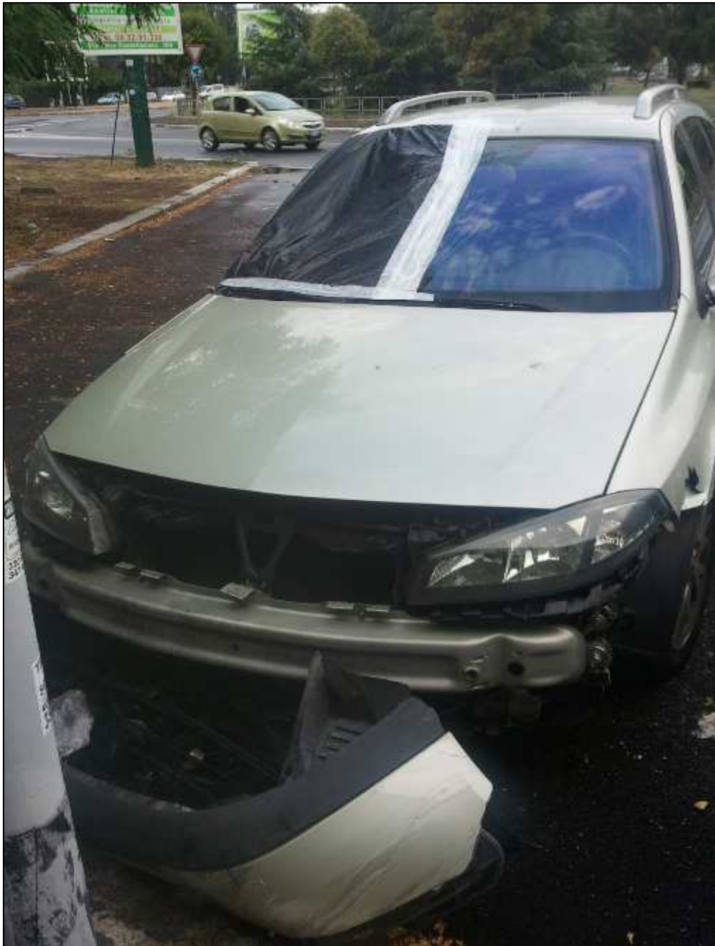
rotatoria tra via della Grande Muraglia a via Don Pasquino Borghi, tra Mostacciano e Torrino (24 luglio 2012)