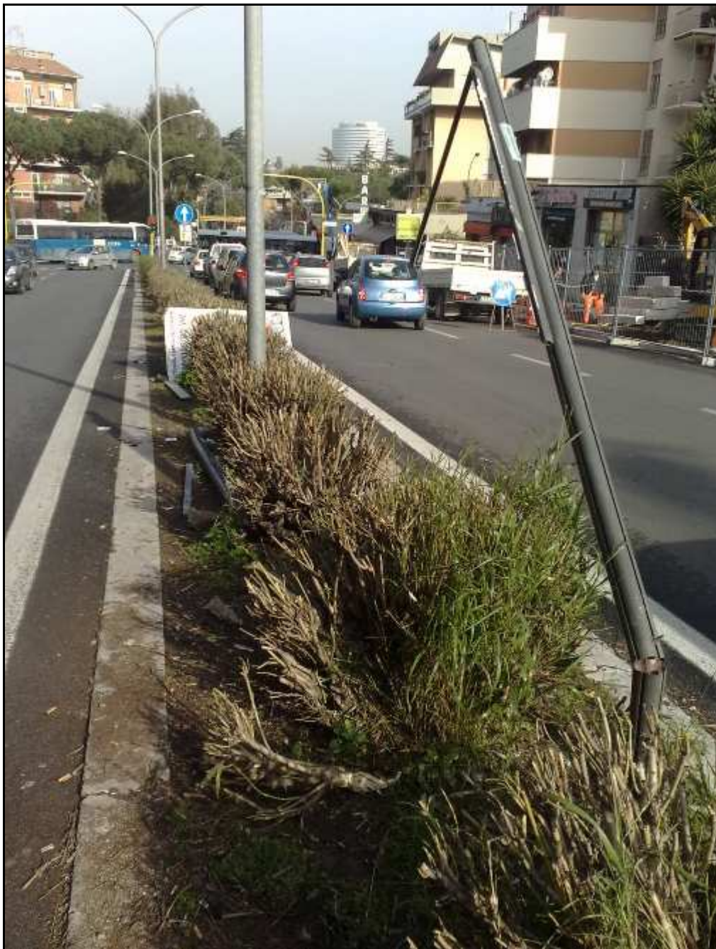
via Laurentina 627 all'altezza di Via dei Sommozzatori (15 marzo 2011)