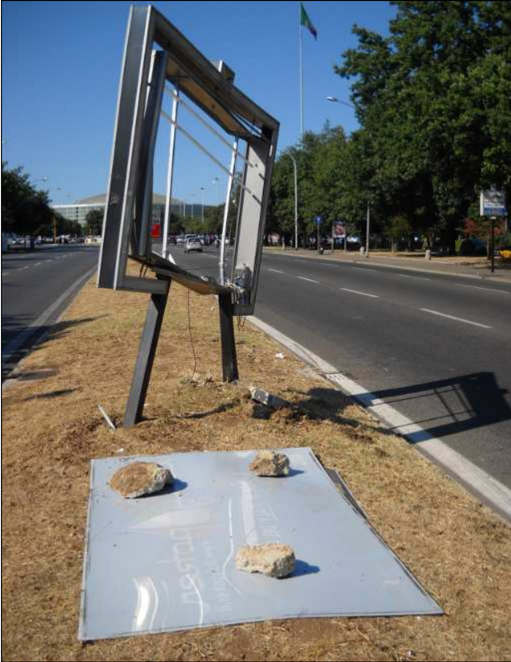
Via Cristoforo Colombo tra il palazzo dello Sport e viale dell'Oceano Pacifico (17 luglio 2011)