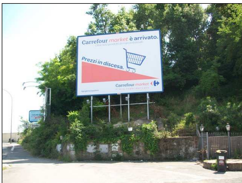
Viale di Tor di Quinto