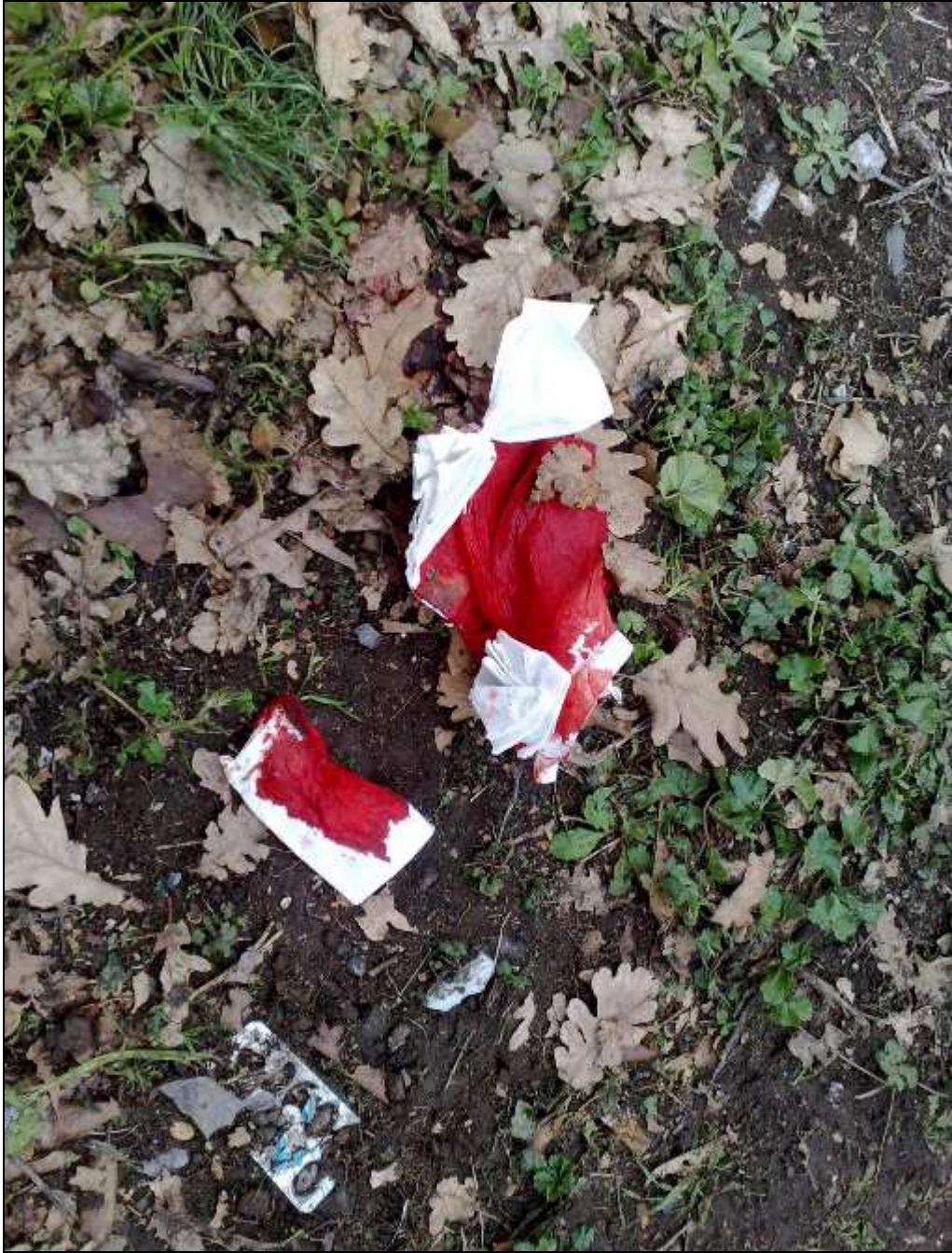
Spartitraffico centrale della via Cristoforo Colombo compreso tra il palazzo dello Sport e viale dell'Oceano Pacifico (2 gennaio 2012)