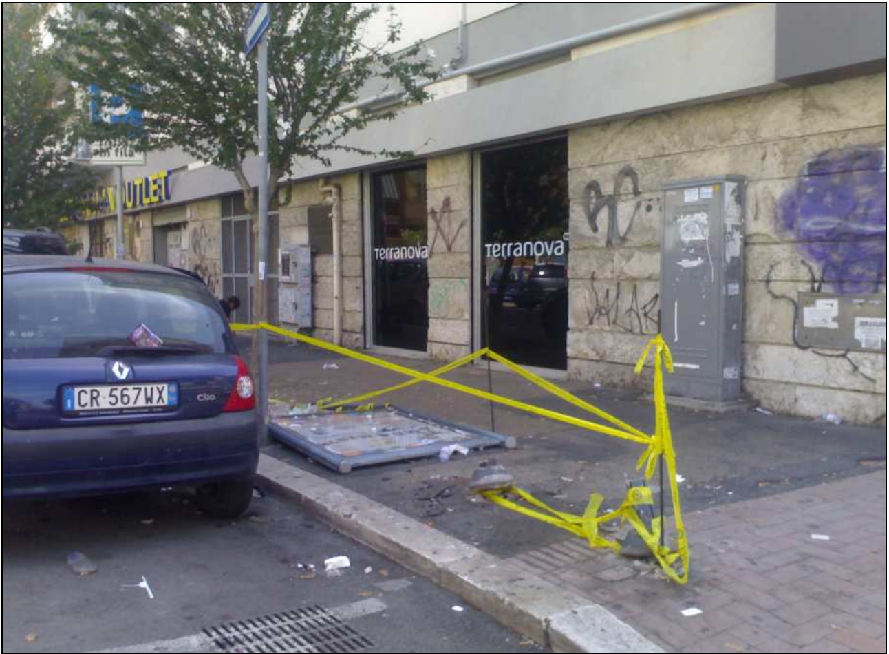
Ostia (19 settembre 2011)