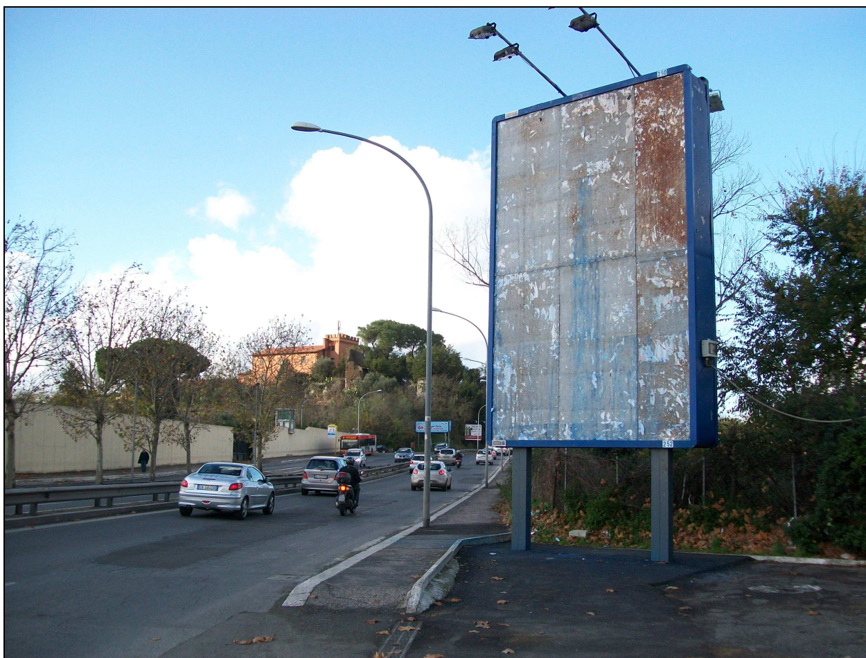
Viale di Tor di Quinto : sullo sfondo il casale di Tor di Quinto sulla collina omonima