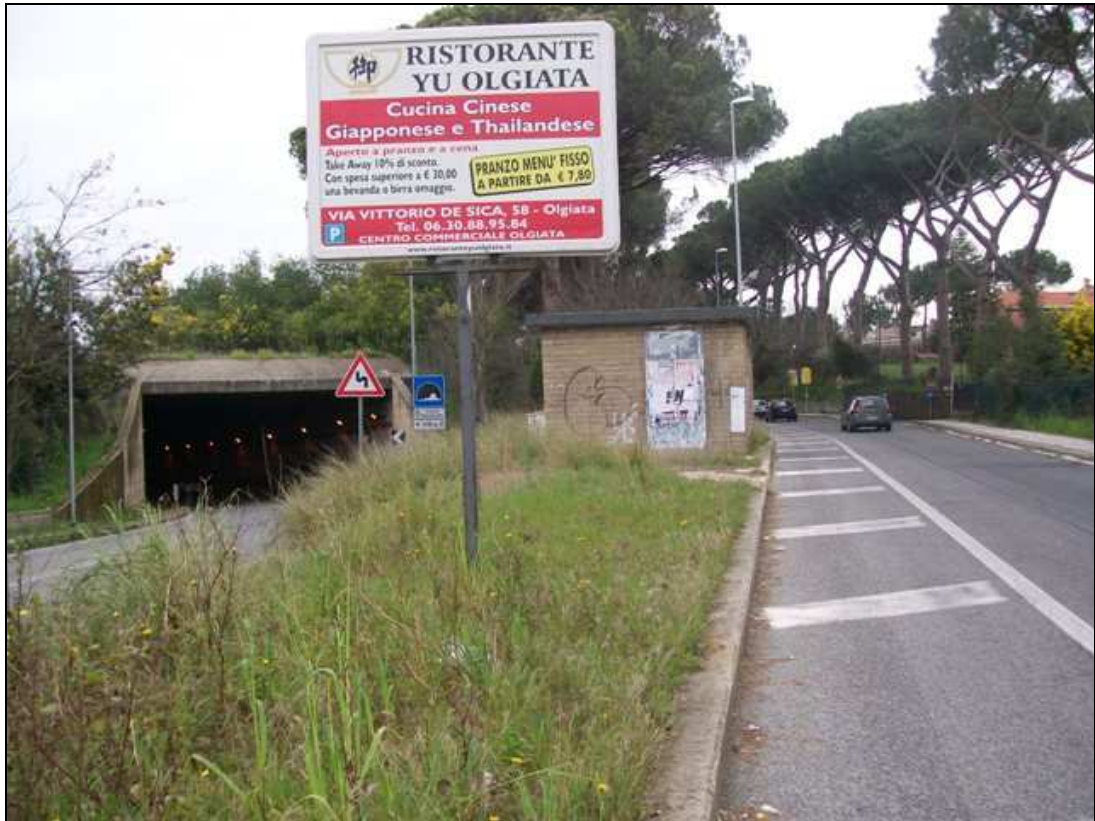
Via Cassia Km. 15,375