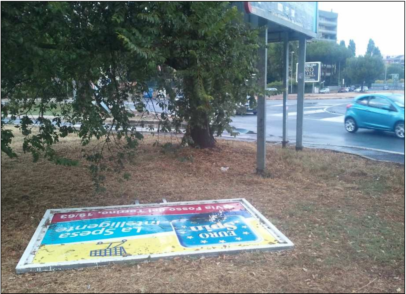
rotatoria tra via della Grande Muraglia a via Don Pasquino Borghi, tra Mostacciano e Torino (24 luglio 2012)