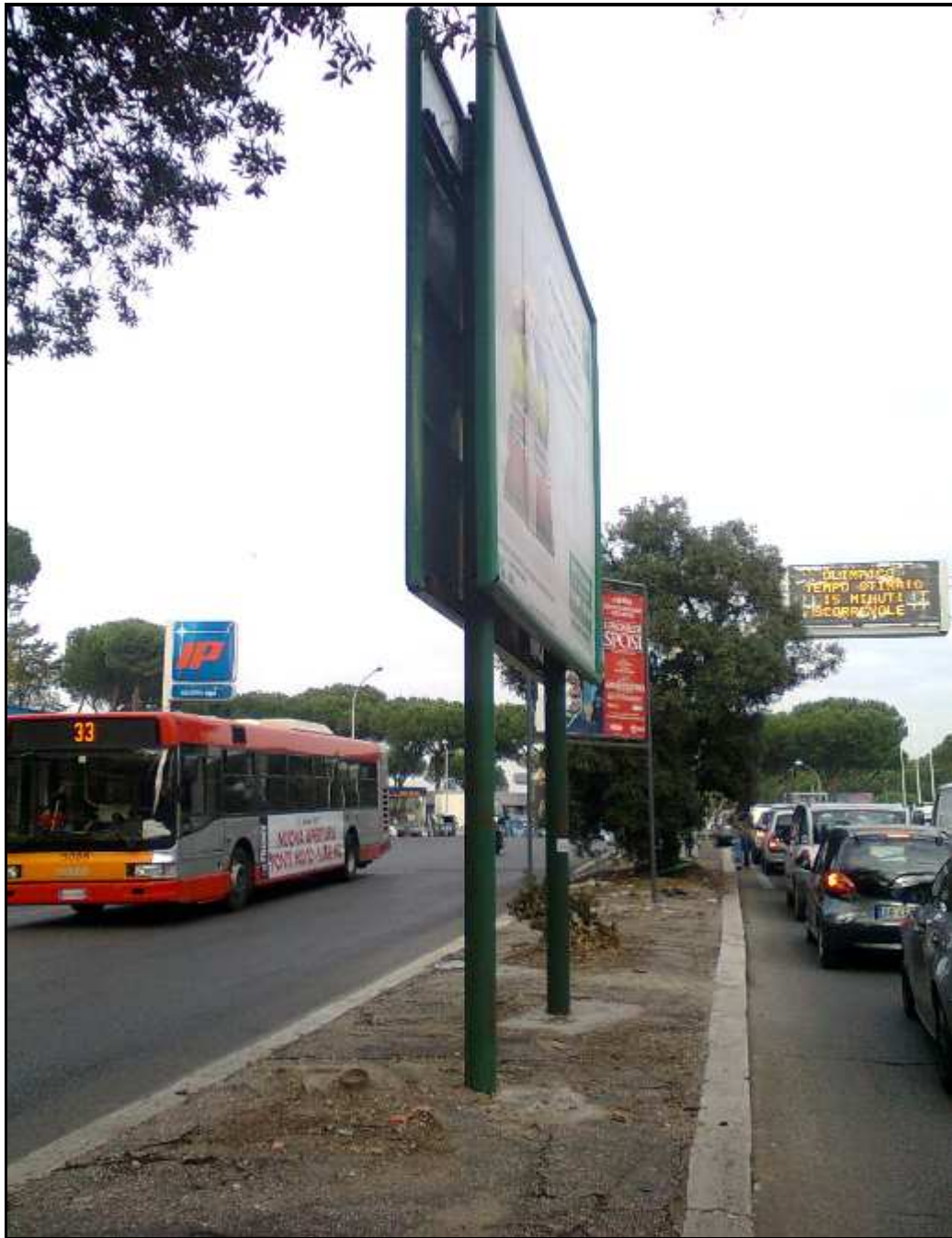
Via Ottavio Gasparri prima dell'incidente