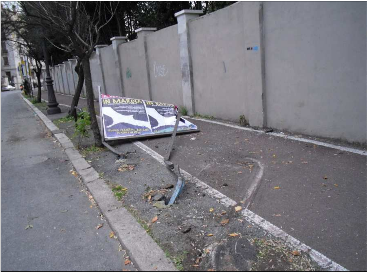
Via Panama (8 gennaio 2012)