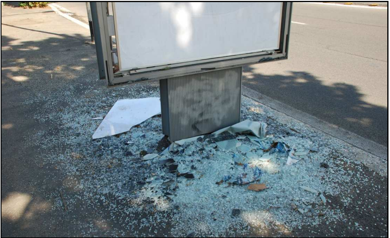
Via delle Valli (20 settembre 2011)