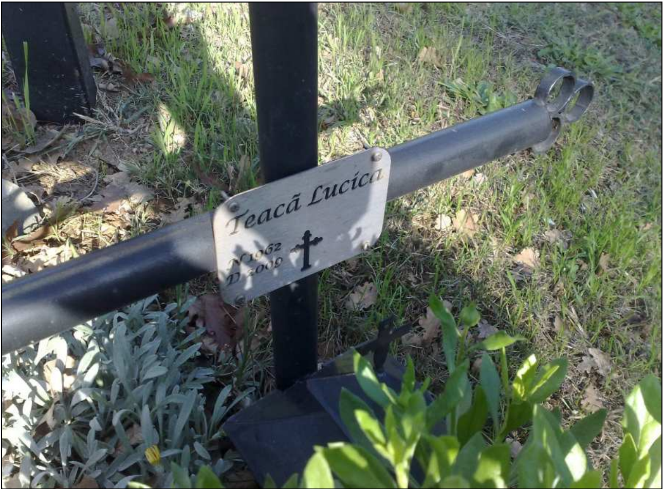
Incidente mortale avvenuto nel 2009