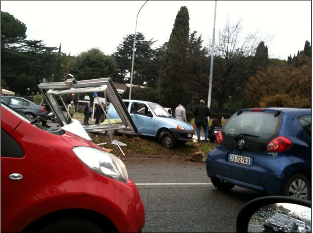
Spartitraffico centrale della via Cristoforo Colombo compreso tra il palazzo dello Sport e viale dell'Oceano Pacifico (2 gennaio 2012)