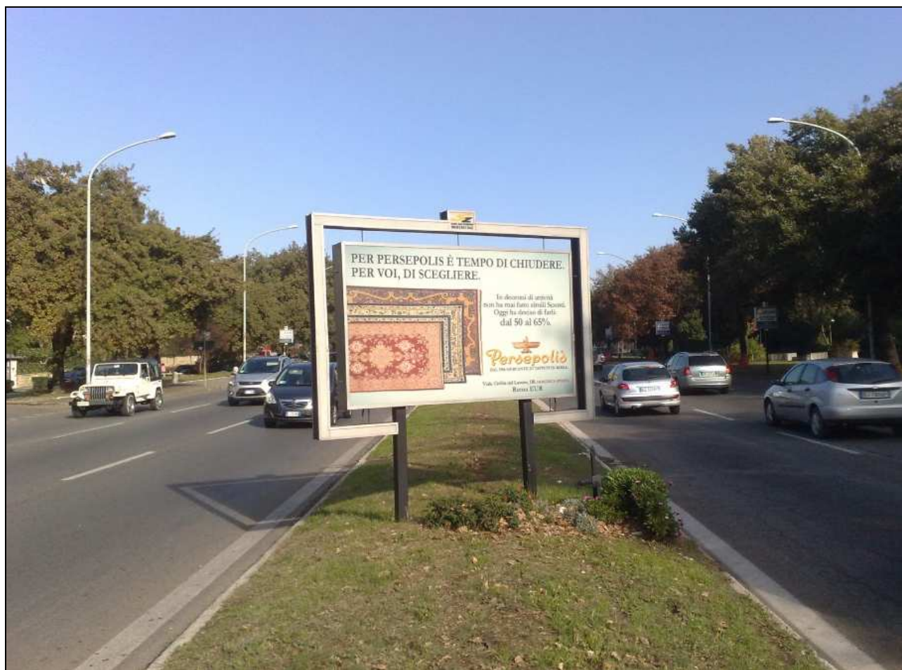
Via Cristoforo Colombo tra il palazzo dello Sport e viale dell'Oceano Pacifico