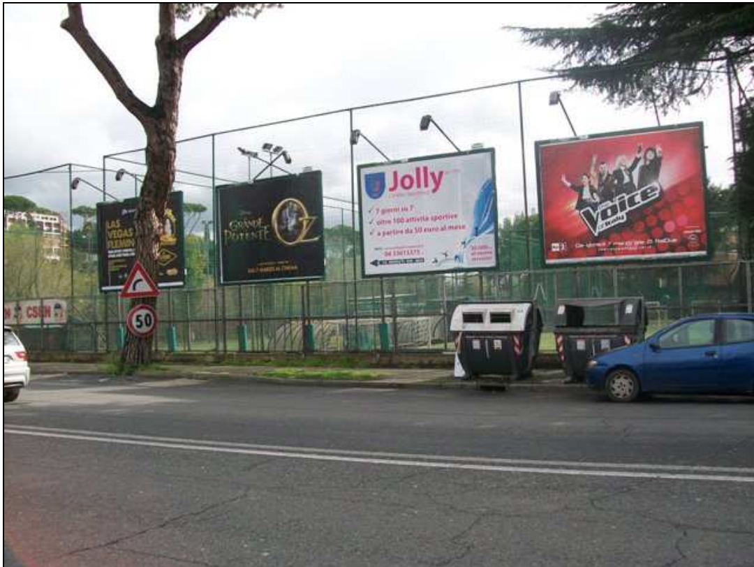
Via Flaminia Nuova