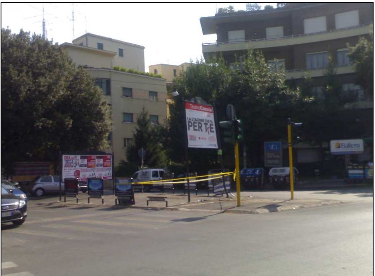
Isola pedonale Via Salaria, incrocio Via Chiana (26 settembre 2011)