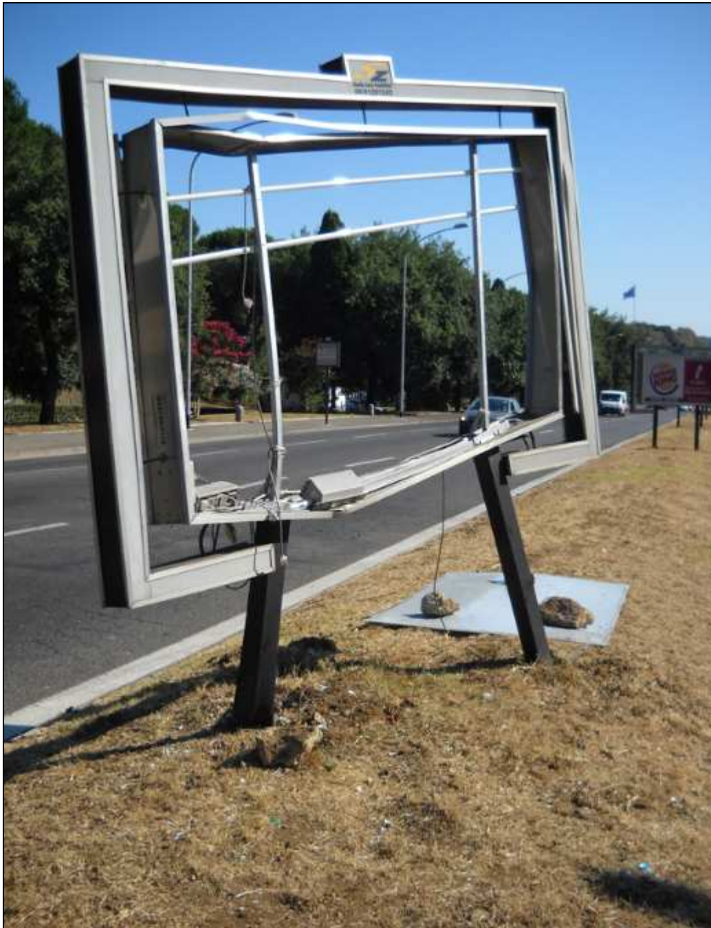
Via Cristoforo Colombo tra il palazzo dello Sport e viale dell'Oceano Pacifico (17 luglio 2011)