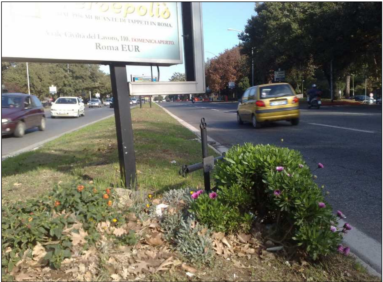
Via Cristoforo Colombo tra il palazzo dello Sport e viale dell'Oceano Pacifico