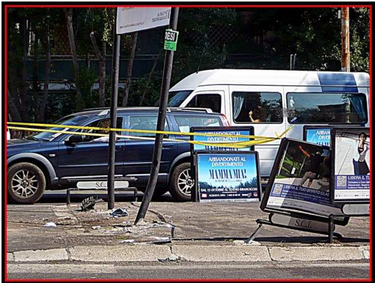
Isola pedonale Via Salaria, incrocio Via Chiana (26 settembre 2011)