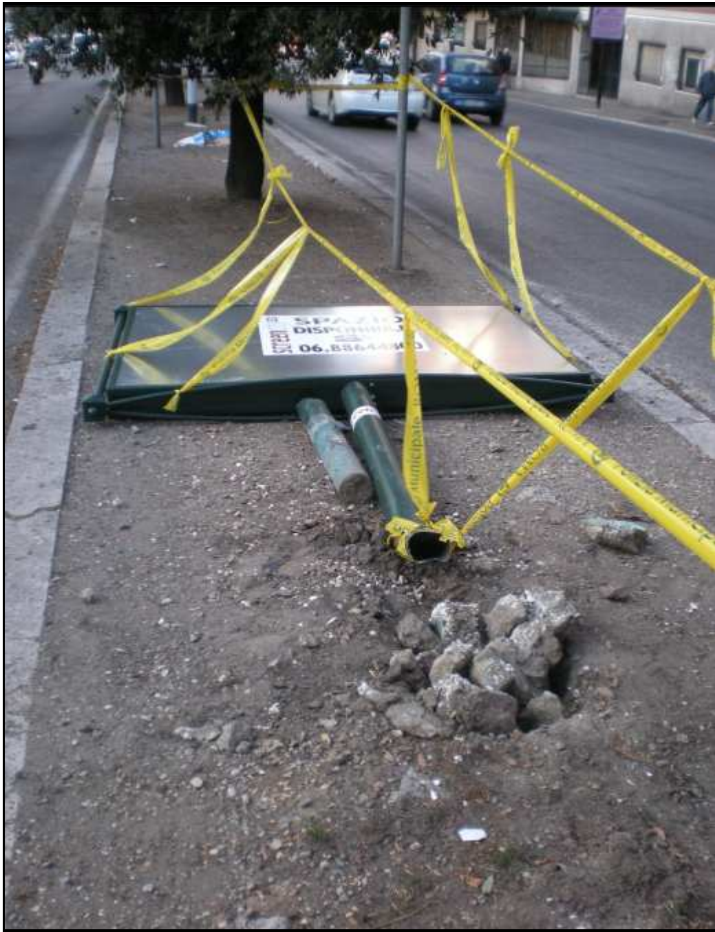
Spartitraffico centrale di via Leone XIII (21-22 ottobre 202011)