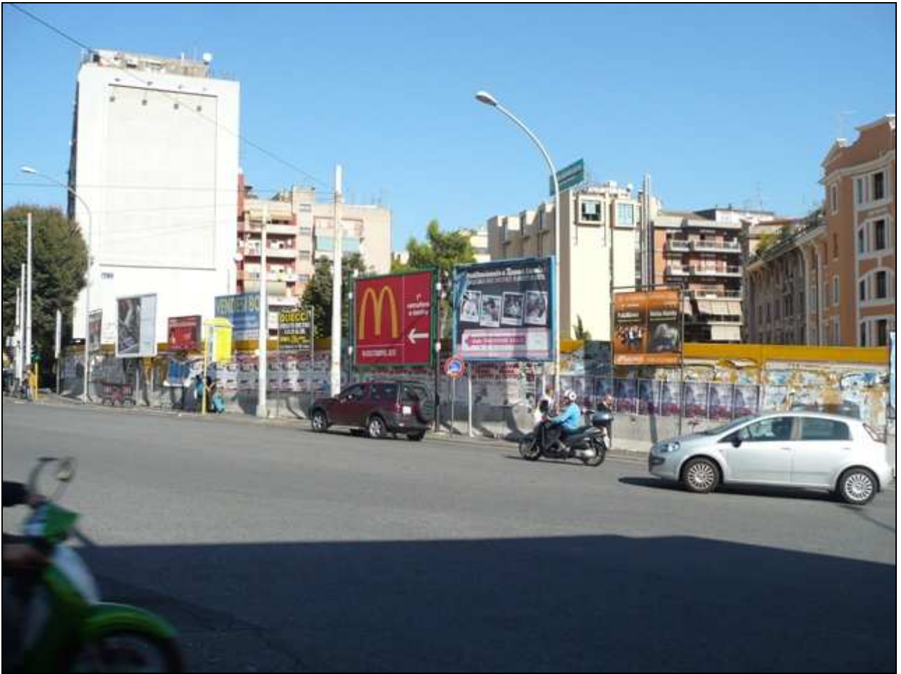
via degli Orti di Cesare