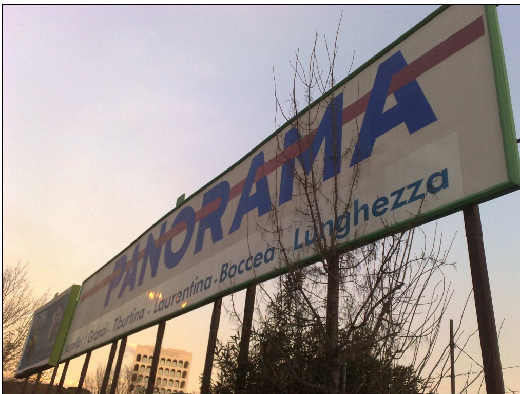
Viadotto della Magliana