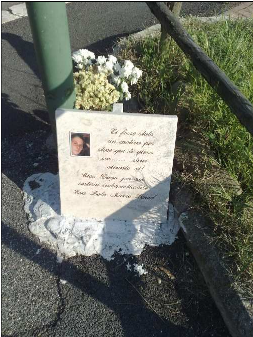
Incrocio di via Virgilio Talli con via Nazzareno de Angelis (30 marzo 2012)