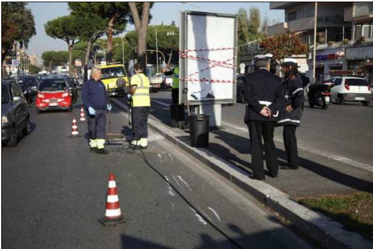
Spartitraffico centrale di via Tuscolana: 2 morti (2 novembre 2011)